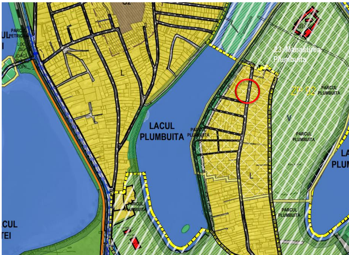
Extras din PUZ Sector 2 aflat în etapa de Informarea Populației, faza Elaborarea Propunerilor ( www.urbanism.pmb.ro )