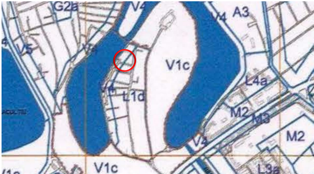
Extras din PUG MUNICIPIUL BUCUREȘTI, aprobat prin HCGMB nr 269/2000.